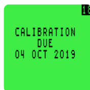
Opciones de calibración configurables