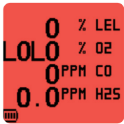
Punainen näyttö hälytystilassa